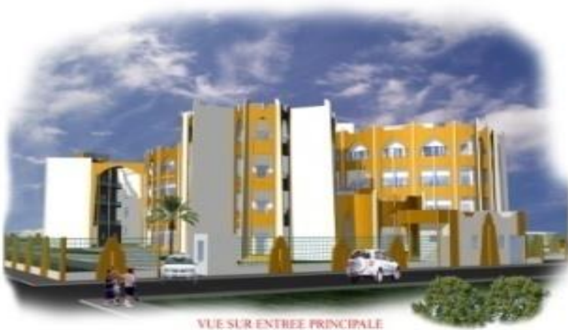
VUE SUR ENTREE PRINCIPALE